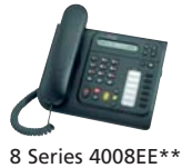
8 Series 4008EE**