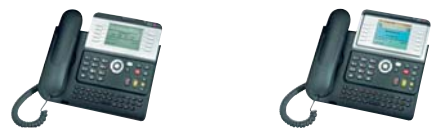
8 Series 4038EE