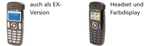
300 DECT Telefon