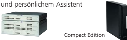
OmniPCX Office 19" Rack Compact Edition für die Wandmontage