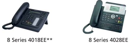
8 Series 4018EE**